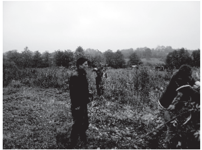
Und noch mehr Helfer

Wir möchten uns bei allen fleissigen Helfern bedanken und hoffen, dass sie uns alle auch weiterhin mit ein paar Stunden Hilfe unterstützen werden. Ohne Euch wäre dies Projekt nicht so schnell realisiert worden und ich persönlich möchte Euch sagen, dass es mir unheimlichen Spass bereitet hat, mit Euch zusammen etwas zu schaffen, das uns alle noch viele Jahre erfreuen wird.