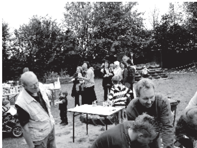
Viele interessierte Zuschauer beim Pressen und bei den Vogelhäusern

Am 26. September fand das erste Blumenthaler Apfelfest statt. Ausgerichtet von den Eltern der Kindergartenkinder und Kulturblume sorgte das Fest bei allen Besuchern für Spass. Es gab frisch gepressten Apfelsaft aus Blumenthaler Äpfeln, Stoffäpfel, Apfelspiralen und für die Kinder geschminkte Gesichter.