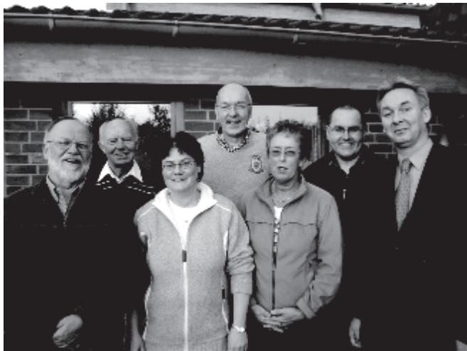
Bürgermeisterin Topp und EnUmBlu - lauter strahlende Gesichter

Praxis weitergegeben werden. Wenn es dann, wie wir hoffen, zu konkreten Baumaßnahmen mit dem Ziel: Energie-Plus-Haus kommt, benötigen wir die entsprechend ausgebildete Fachleute vor Ort. Denn dieses Konzept ist in dieser Form bislang nur in Siegen bekannt.