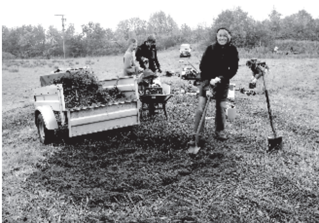
Viele fleissige Helfer

Wir möchten uns bei allen fleissigen Helfern bedanken und hoffen, dass sie uns alle auch weiterhin mit ein paar Stunden Hilfe unterstützen werden. Ohne Euch wäre dies Projekt nicht so schnell realisiert worden und ich persönlich möchte Euch sagen, dass es mir unheimlichen Spass bereitet hat, mit Euch zusammen etwas zu schaffen, das uns alle noch viele Jahre erfreuen wird.